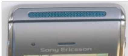
Sowohl oben als auch unten hat das W595 jeweils eine relativ große Schallöffnung - dadurch ergibt sich im Querformat ein recht passables Stereoelebnis

den reichen. Der allgemeine Bordkomfort des W595 ist ebenfalls recht ordentlich. So gibt es ein Telefonbuch mit zahlreichen Datenfeldern, einen Terminkalender mit möglicher akustischer Alarmierung, einen Wecker für fünf programmierbare Ereignisse, einen Timer, eine Stoppuhr, ein Codememo für Geheimzahlen und eine trainierbare Spracherkennung für Telefonbucheinträge. Außerdem lassen sich Sprachmemos aufzeichnen und Digitalfotos nachbearbeiten oder mit Texten beziehungsweise Grafikelementen versehen.