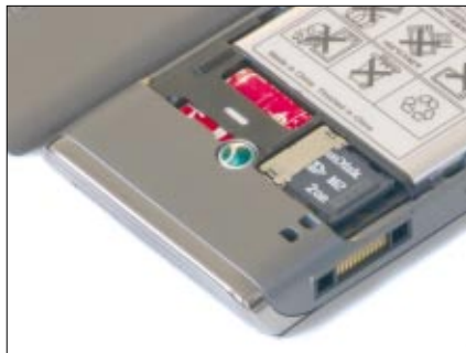
An den MemoryStick Micro kommt man erst nach Abnahme des Rückdeckels heran