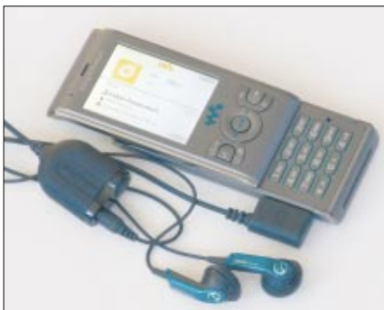
An die Mikrofoneinheit des W595 lässt sich auf Wunsch sogar ein zweites Headset für den doppelten Musikgenuss durch zwei Personen anschließen

Der Bordspeicher ist mit 40 MByte für ein HSDPA-Handy nicht überwältigend, er wird aber bereits serienmäßig von einem MemoryStick-Micro mit 2 GByte unterstützt. Zum Wechseln des Speichermediums muss man zwar den Kunststoff-Rückdeckel Fingernagel-unfreundlich mit sanfter Gewalt öffnen, immerhin lässt es sich dann aber auch bei eingeschaltetem Handy entnehmen. Die Kapazität des Lithium-Polymer-Akkus ist mit 950 mAh für ein so kleines Handy recht üppig bemessen - laut Datenblatt soll dies selbst in UMTS-Netzen für eine Sprechzeit von bis zu 4,5 Stunden oder für eine Standby-Zeit von maximal 365 Stun-