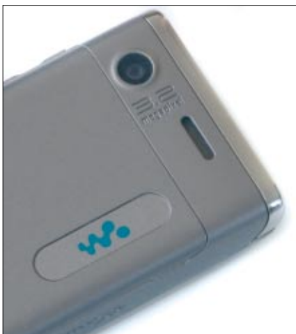
Von der kleinen Digitalkamera mit 3,2 Megapixel darf man keine Wunder verlangen, zumal das Handy auch keine Fotoleuchte hat