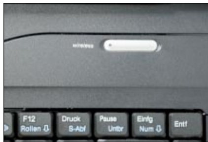
Schnell und unkompliziert lässt sich das eingebaute Wireless-LAN-Modul ein- und ausschalten

Kunststoff den unteren Geräteteil. Nach dem Aufklappen aber wirkt das Gerät einfach nur edel und schick! Mit Ausnahme des Ein-/Auschalters, des Wireless-LAN-Schalters sowie der beiden Tasten unter dem Touchpad sind sämtliche Elemente schwarz. Und einmal mehr bestätigt sich dabei: »Black is beautiful!«.