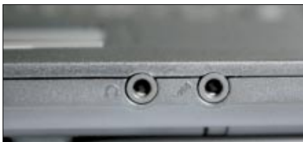
Zu störenden Kabeln vor dem Gerät können die an der Frontseite platzierten Audio-Anschlüsse führen