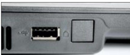
Der dritte USB-Port ist an der linken Seite zu finden - der Platz für die Modembuchse bleibt hingegen ungenutzt