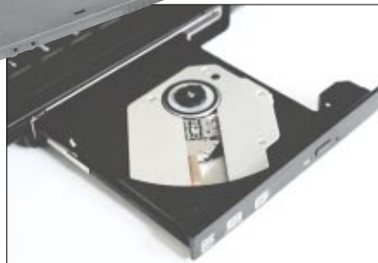
Das optische Laufwerk ist fest eingebaut und kann CD- und DVD-Medien lesen und beschreiben