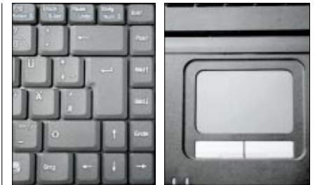
▲ Auch für längere Schreibarbeiten ist die Tastatur des Mobile Business 2500 hervorragend geeignet

Der Blick in die technischen Daten überrascht. Wortmann hat sich beim neuen Mobile-Business-Modell nicht für die Centrino-2-Generation entschieden. Vielmehr kommen Komponenten der »Santa Rosa«-Generation zum Einsatz. Das wirkt wie ein Rückschritt. Tatsächlich aber sind die einzelnen Komponenten mehr als leistungsstark genug, um aus dem Terra-Notebook ein leistungsstarkes Arbeitsgerät zu machen. Zwar sind die aktuelleren Montevina-Bestandteile insbesondere mit Blick auf Video-Anwen-