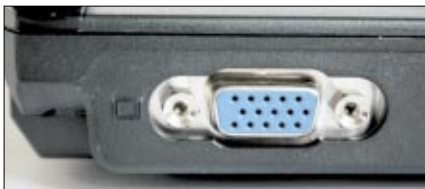
Der seitliche RGB-Port ermöglicht den Anschluss eines externen Monitors oder Projektors

Ein echtes Kaufargument ist das Display. Wie erwähnt misst es 15,4 Zoll in der Diagonalen. Die Auflösung liegt bei 1280 mal 800 Bildpunkten, so dass die Darstellungsdichte augenfreundliche 98 dpi beträgt. Für