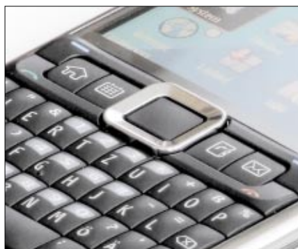
Die Naviwippe ist zwar mit 14 mal 13 Millimetern nicht gerade groß, dank hohem Rand ist sie aber durchaus per Daumen bedienbar

Preis 416,50 Euro (ohne Vertrag), Internet www.nokia.de