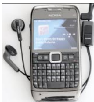
◀ Sowohl der eingebaute Lautsprecher als auch das mitgelieferte Stereo-Headset klingt recht voluminös