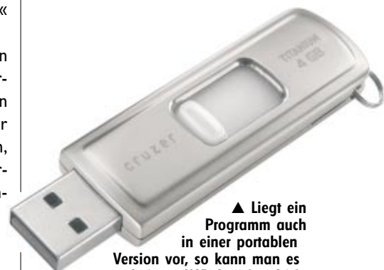
▲ Liegt ein Programm auch in einer portablen Version vor, so kann man es auf einem USB-Speicher-Stick einsatzbereit mit sich herumtragen (Foto: SanDisk)