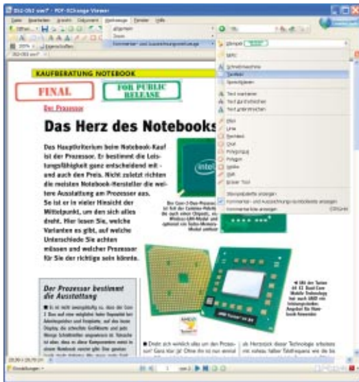
Der PDF-XChange Viewer erlaubt es, Anmerkungen und Markierungen in PDF-Dateien einzufügen