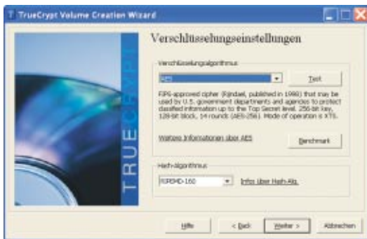
TrueCrypt legt ein virtuelles Speichermedium an, das Ihre Dateien automatisch verschlüsselt